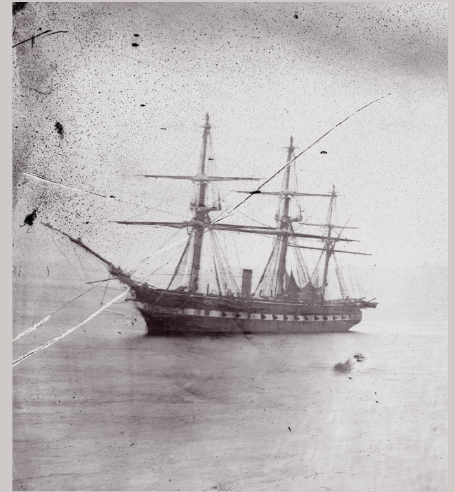
FRAGATA RESOLUCIÓN, NAVE CAPITANA DE LA EXPEDICIÓN.