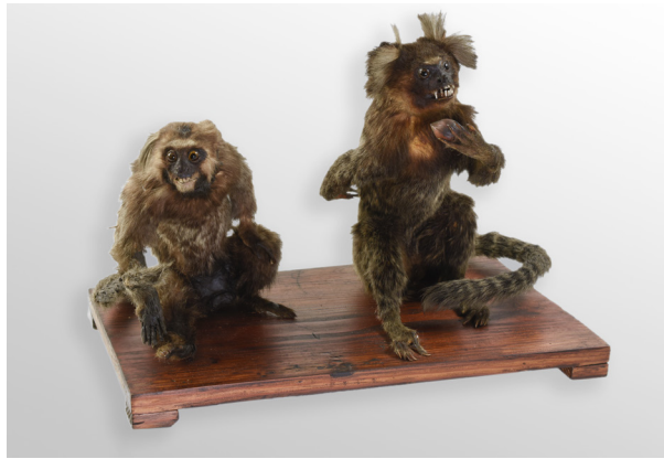
TITÍ COMÚN. CALLITHRIX JACCHUS (LINNAEUS, 1758) BRASIL. COLECCIÓN DE MAMÍFEROS