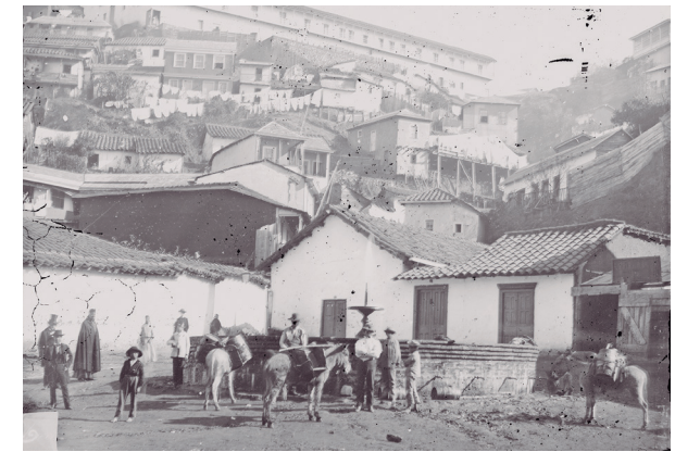
PLAZA EN VALPARAÍSO. CHILE.