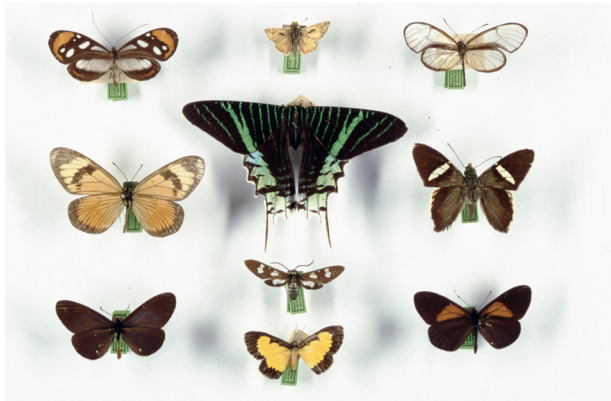
MARIPOSAS DE DIVERSOS GRUPOS COLECTADAS EN LA EXPEDICIÓN. COLECCIÓN DE ENTOMOLOGÍA.