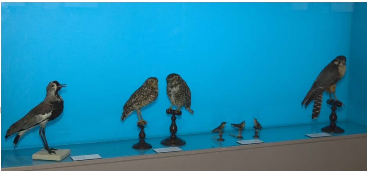
Algunas de las aves naturalizadas que se muestran en la exposición

que difícilmente se pueden encontrar en otras partes del mundo. Uno de los objetivos de esta exposición es pues acercar las aves de estas lejanas tierras a los visitantes del MNCN pero, en esta ocasión, a través de los trazos y pinceladas del pintor, ornitólogo y autor de la muestra, Ramón Auzmendi. En total, 34 obras (24 acuarelas y 11 tintas) que se complementan con una selección de ejemplares naturalizados del MNCN.